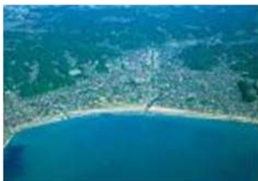
かまくら ちけい (鎌倉の地形)