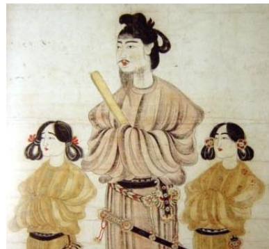
し ょ う と く たい し (聖徳太子) (เจ้าชายโชโททะคุ)