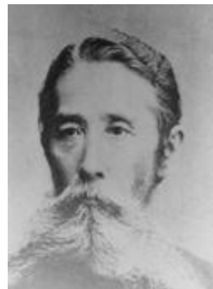
じゅう み ん けん う ん どう い た が き た い す け (自由民権運動をすすめた板垣退助)