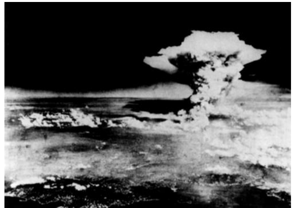
げんぼく (原爆によるきのこ雲)

(ตึกที่ถูกระเบิดปรมาณูที่ฮิโรชิมา เกินบะคุโดม)