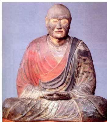
がんじん (鑑真) (พระกัจฉิน)