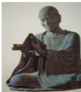
たいらの きよもり (平 清盛)