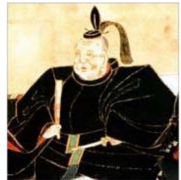
とくがわ いえやす (徳川 家康)