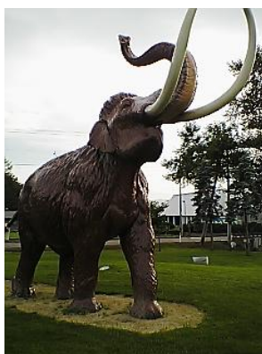
ぞう (ナウマン象) (ช้างนาอุมัน)