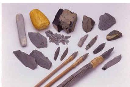
せつき (石器) (เครื่องมือที่ทำจากหิน)