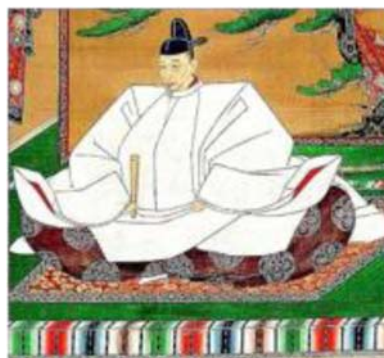
とよとみ ひでよし (豊臣 秀吉)