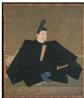
みなもとの よりとも (源 頼朝)