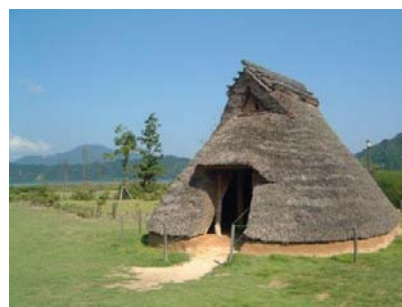
たてあなじゅうきょ (竪穴住居) (ถ้ำทาเทอานะ)