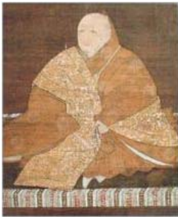
あしかが よしよしみつ (足利 義満)

3代将軍義満の時に最盛期を迎え、日本の代表的建築「金閣」も作られました。8代将軍も義満をまねして「銀閣」を作りますが、この頃からは武士同士の争いも多くなり混乱します。