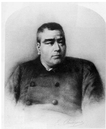
せい な ん せん そう さい ご う た か も り (西南戦争をおこした西郷隆盛)