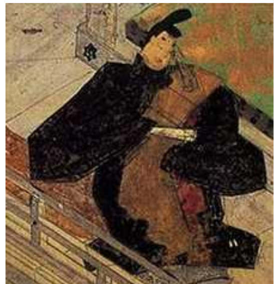
ふじわら みちなが (藤原道長)