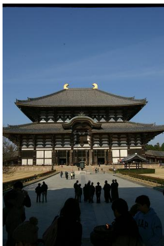
とうだいじ (東大寺) (วัดโทไดจิ)