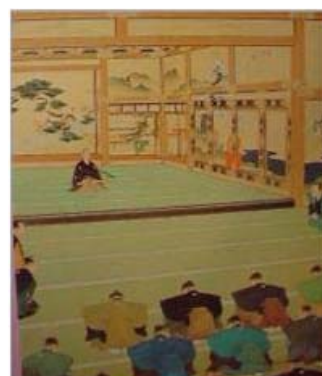
たいせいほうかん つ ようす (大政奉還を告げる様子)