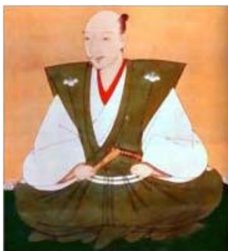
おだ のぶなが (織田 信長)

織田信長・豊臣秀吉・徳川家康という有名な武士が出てくるのもこの時代です。最後には徳川家康が勝ち、江戸幕府を作りました。