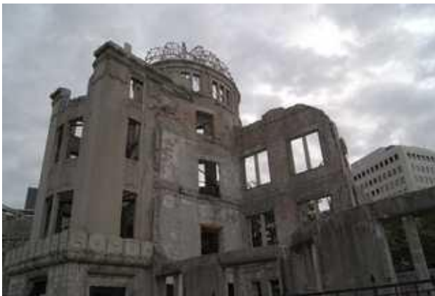
ひろしま げんぼく (広島 原爆ドーム)

また、8月8日には、ソ連も日本に宣戦を布告しました。そこで日本は、 ポツダム宣言を受け入れ1945年8月15日に無条件降伏しました。