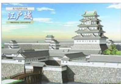
えどじょう (江戸城)