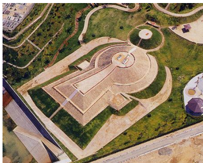
こ ふ ん (古墳) (โกะฟุน)